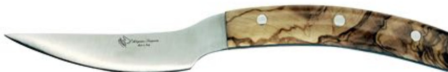
Olivo ・ オリーブ ¥ 13,000