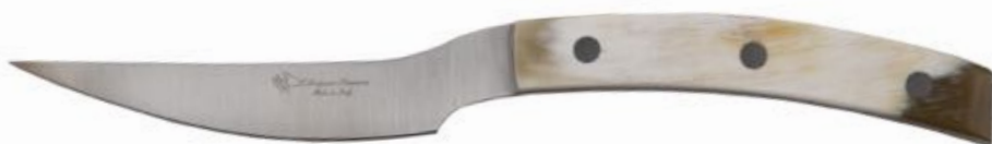
Corno di Bue ・ 牛角 ¥ 15,000

Il coltello bistecca Becco d'Aquila ha una linea moderna con materiali tradizionali. La forma particolare, permette di tagliare la carne con maggiore facilità grazie all'angolatura del manico e alla forma particolare della lama.